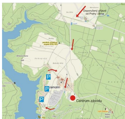
Miroslav Hlava hlavní rozhodčí